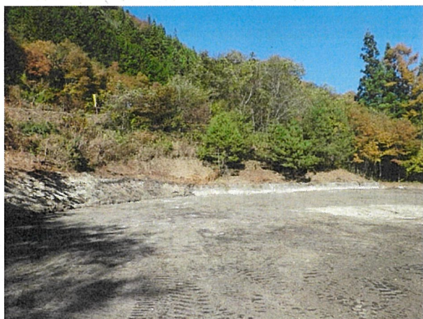
施工ヤードの草刈りを行った後、整地を行いました。