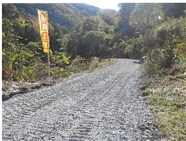
施工ヤードに降りていく進入路の整備を行いました。