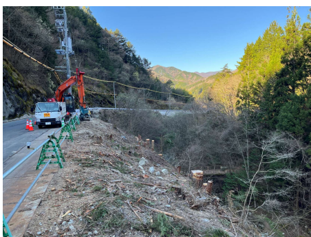
区間② 伐採工 2026年4月8日