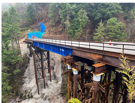
区間①う回路 仮橋工 2026年4月2日