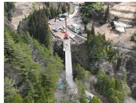
区間①う回路 仮橋工 2026年3月30日