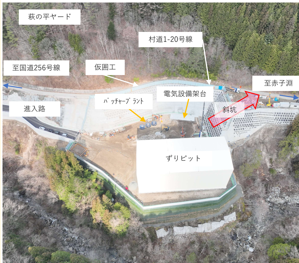
非常口ヤード, 進入路 ドローン撮影 2026年3月30日