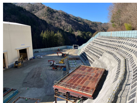
非常口ヤード トンネル仮設備工 2026年4月8日