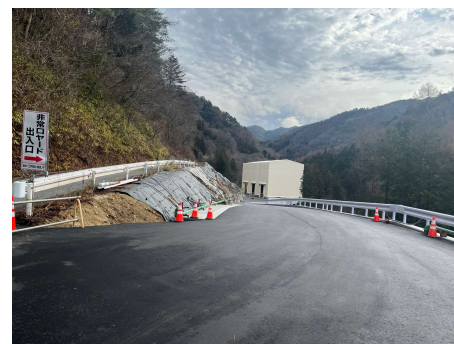
萩の平ヤード 進入路 舗装工 2026年4月3日