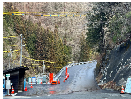
村道区間①下流 舗装工 2026年3月7日