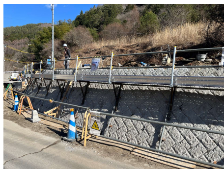
村道区間② 擁壁工 2026年3月4日