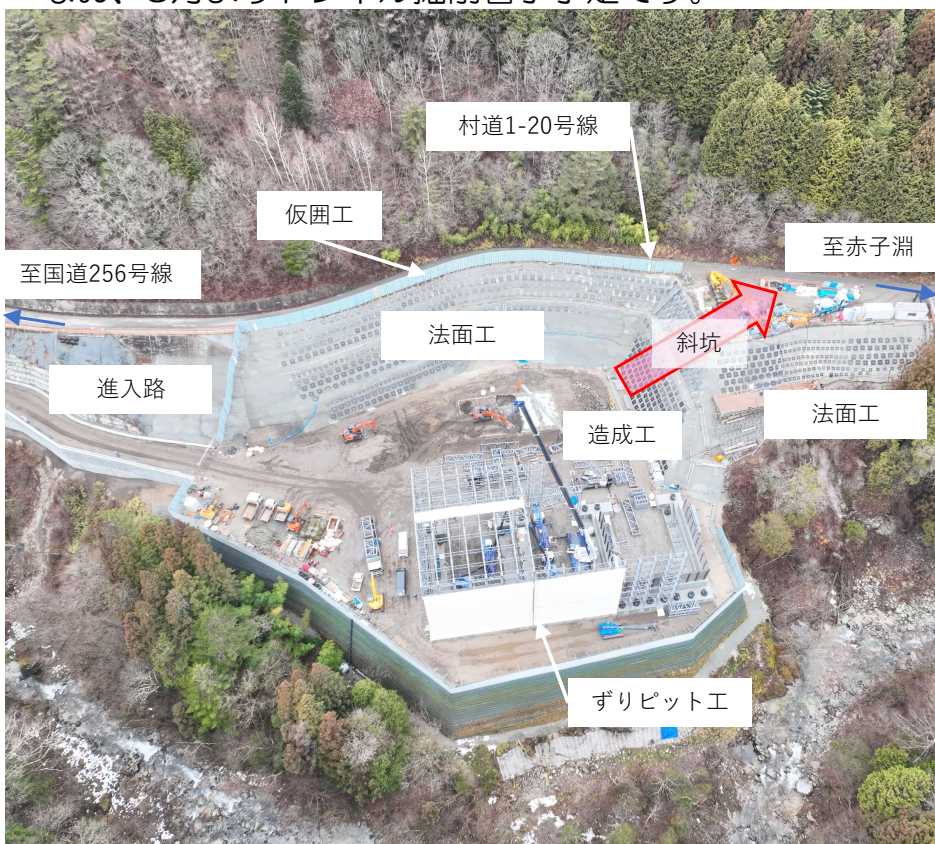
非常口ヤード,進入路 ドローン撮影 2026年2月26日