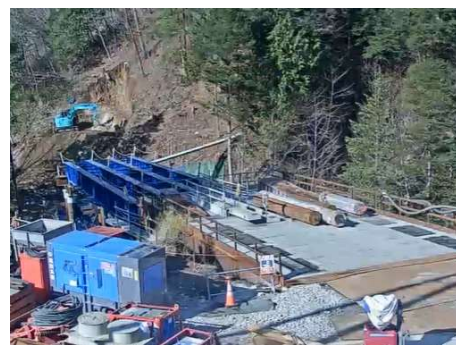
う回路 仮橋工 2026年3月5日