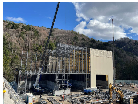
非常口ヤード トンネル仮設備ずりピットテント工 2026年3月4日