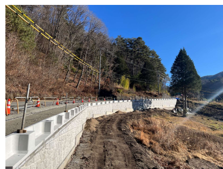
村道区間③ ガードレール基礎工 2025年12月9日