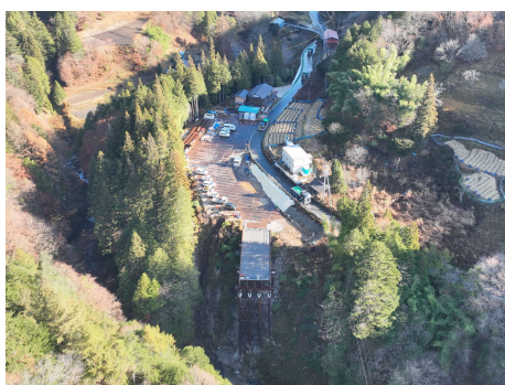
う回路上流側 ドローン撮影 2025年11月26日