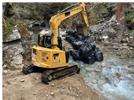
区間①う回路 仮締切工 2025年12月3日