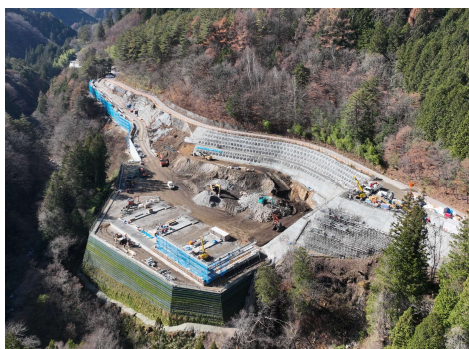
非常口ヤード ドローン撮影 2025年11月26日

現在、萩の平非常口ヤードで法面工、ヤード造成工、トンネル仮設備工(ずりピット工)、非常口ヤード進入路で壁面工、路床工、村道区間①下流で石積擁壁工、区間②③でガードレール基礎工、路盤工、区間⑤で伐採工、う回路下流側で地盤改良工、既設構造物撤去工、上流側で仮締切工、仮橋工を行っています。