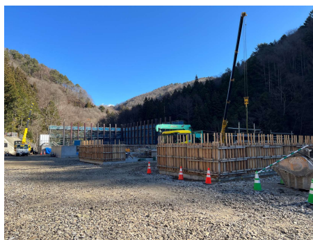
非常口ヤード ずりピット工 2025年12月9日