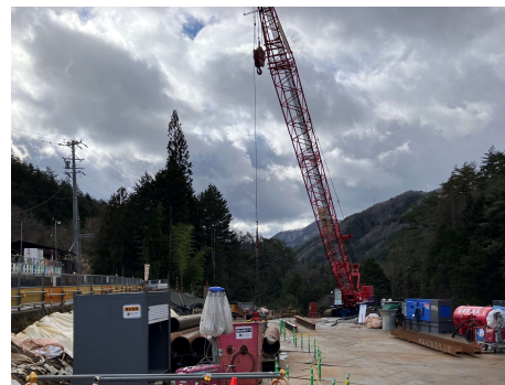
う回路上流側 100tクレーン作業状況 2025年12月15日