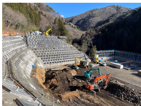
非常口ヤード ヤード造成工 2025年12月9日