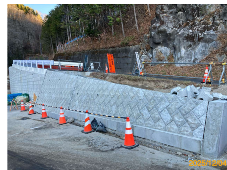
村道区間① 石積擁壁工 2025年12月4日