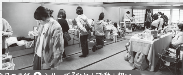
今月の表紙 ▶ シリーズ『ひと+活動+想い』