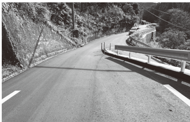
村道1-20号、1-21号改良工事後の様子