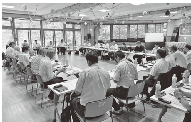
南木曽町議会との合同会議(清中プラザにて)