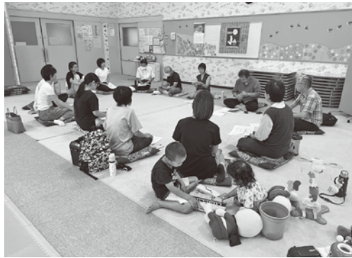
子育て世代との懇談会の様子