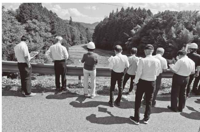
七久里開発予定地

南木曽町議会側からは、クラワ沢の盛り土工事設計の安全性の担保を村や議会はどのように行ったか、盛土規制法成立以前というタイミングとの関連も含め質問があり、当時の村と議会の取り組みの説明をしました。