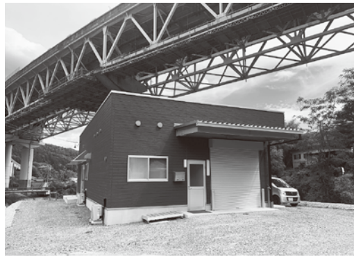
新ジビエ加工施設