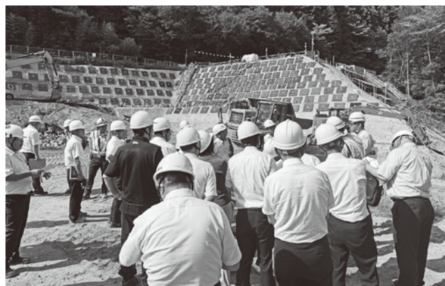
萩の平非常口の様子