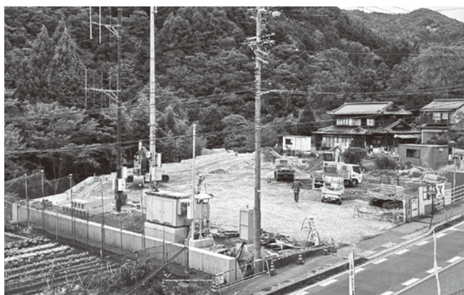
発生土置き場(旧清内路振興室跡)造成地の様子