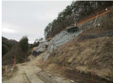
ヤード進入路 地質調査工 2024年4月8日