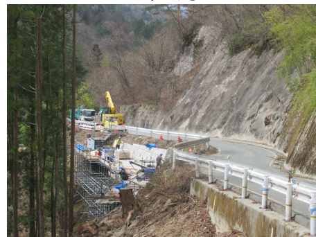
村道区間⑤ パンウォール工_パネル設置 2024年4月8日