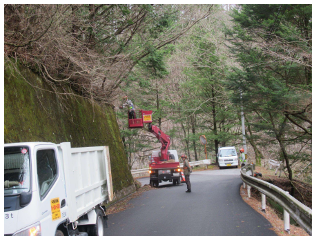
村道区間① 枝払い 2024年4月4日