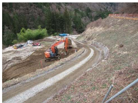
非常口ヤード 造成工事 2024年4月4日

現在、萩の平非常口ヤードで造成工事、ヤード進入路で土工事、 のりめんこう 法面工および地質調査工を、 のりめんこう 村道区間①で土工事、法面工、 のりめんこう 村道区間①～⑤で枝払い、 のりめんこう 村道区間④⑤でパンウォール工を行っています。なお、4月8日に清内路の皆様と座談会を行い、いろいろなご意見をいただきました。今後も続けて行きたいと考えています。