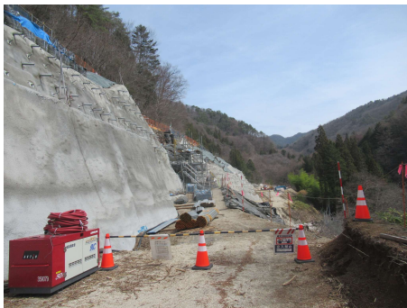
ヤード進入路 のりめんこう 法面工 2024年4月8日