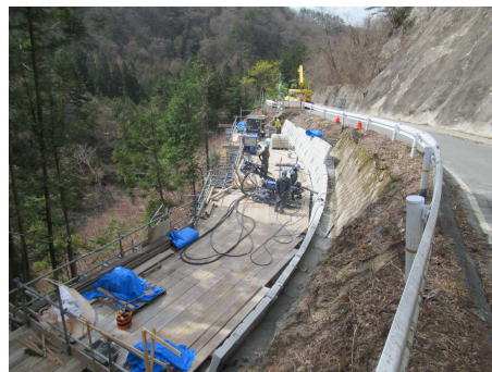
村道区間⑤ パンウォール工_アンカー削孔 さっこう 2024年4月8日