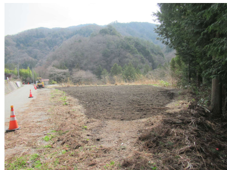
村道区間④ 資材置場撤去 2024年4月8日