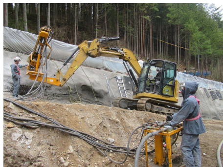
村道区間①下流 のりめんこう 法面工 2024年4月5日