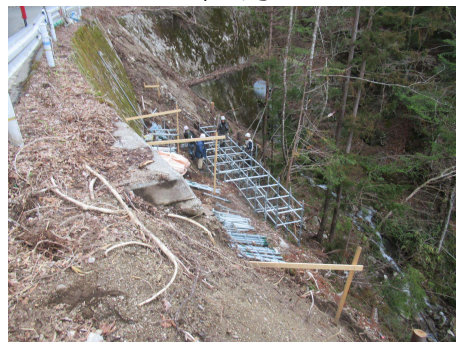
村道区間⑤ パンウォール工_足場組立 2024年4月4日