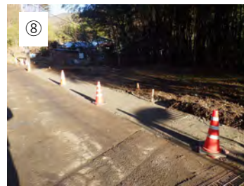
⑧ 【砕石舗装完成】 砕石舗装完成です。今後 ほかの舗装と一緒にアス ファルト舗装します。