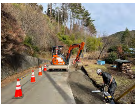
村道区間④ 砕石舗装 2023年12月5日