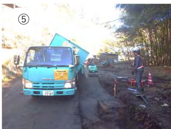
⑤ 【砕石投入】 砕石を投入します。