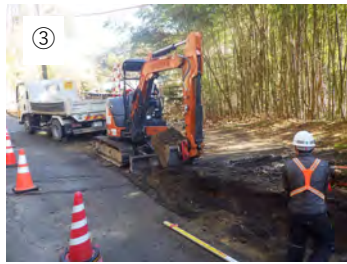
③ 【掘削】 掘削します。