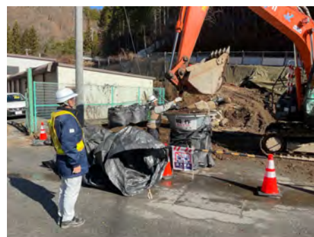
村道区間①下流 廃棄物土のう詰 2023年12月8日