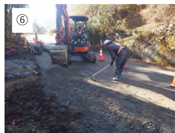
⑥ 【敷均し】 砕石を敷均します。