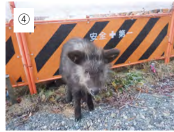
④ 【???】 カモシカの赤ちゃんが見物に きました。