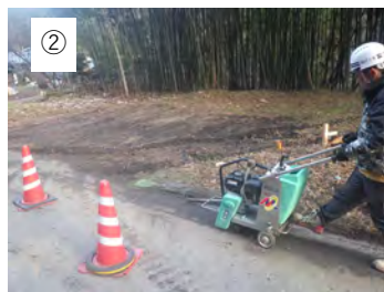
② 【舗装切断】 舗装を切断します。