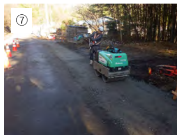
⑦ 【転圧】 砕石を転圧し道路の高さ まで仕上げます。