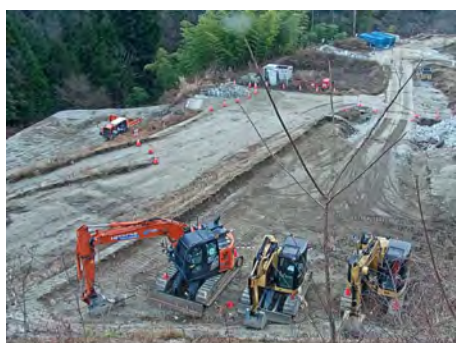
萩の平非常口ヤード 土工事（切土・法面工） 2023年12月10日

現在、萩の平ヤードで地質調査工、萩の平非常口ヤード進入路で土工事（切土・法面工）、村道区間④で砕石舗装工事、村道区間③で水道工事、村道区間①で廃棄物掘削・搬出を行っています。