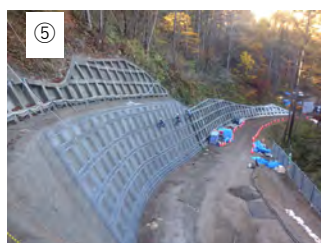
⑤ 【法枠組立】 法枠を組み立てます。