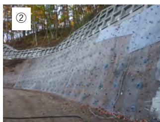
② 【金網設置】 金網を設置します。