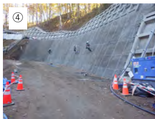
④ 【法枠位置出し】 測量してロープで法枠の位置を出します。