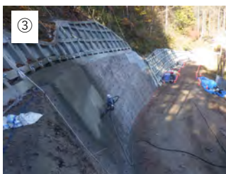
③ 【モルタル吹付】 モルタルを吹き付けます。