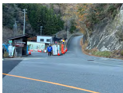
村道区間①下流 誘導員配置 令和5年11月14日