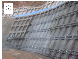
⑦ 【法枠モルタル吹付】 法枠にモルタルを吹き付けします。