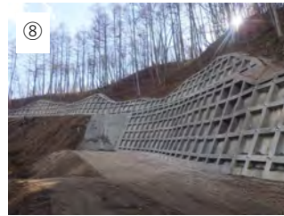
⑧ 【完成】 法枠が完成しました。