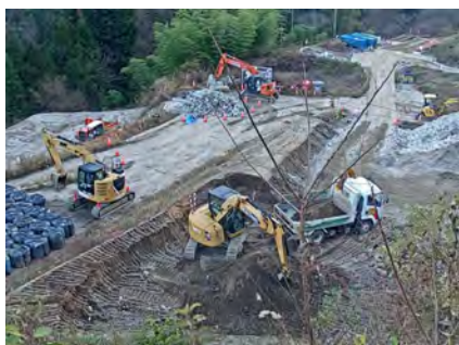
萩の平 非常口ヤード 令和5年11月14日

現在、萩の平ヤード進入路の土工事（切土・法面工）、村道区間⑤で伐採工事、村道区間③で水道工事、村道区間①で樹木移植を行っています。