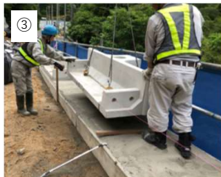
【ガードレール基礎敷設】 モルタルを敷いてガードレール基礎を敷設します。