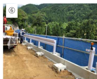
【ビーム取付】 ビームを取り付けます。