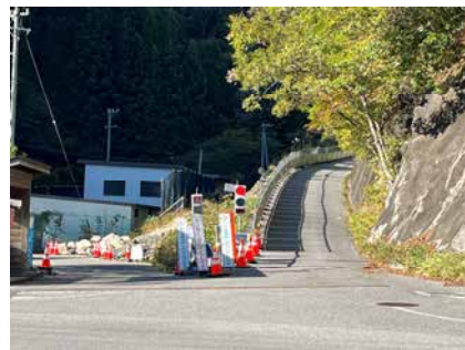
村道区間①下流 センサー式信号 令和5年10月17日