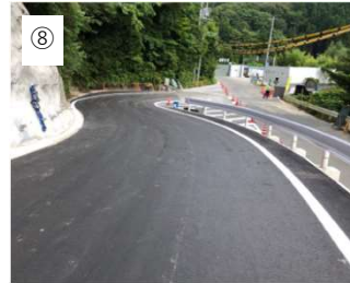
【完成】 舗装して区画線を引いて完成です。