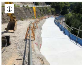
【着工前】 南木曾町で施工した町道棚橋線の事例を紹介します。