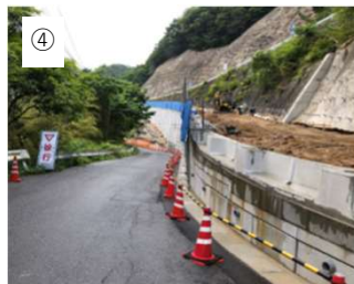
【敷設完了,埋戻】 敷設したら連結して埋め戻します。