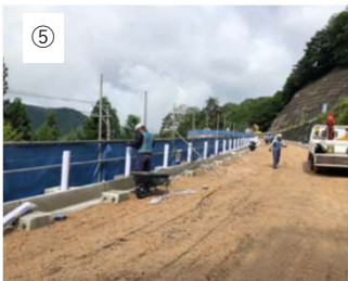
【支柱建込】 ガードレール支柱を建て込みます。