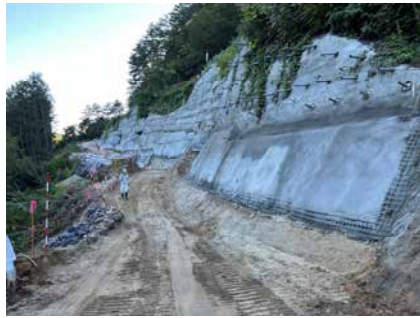
萩の平 ヤード進入路 令和5年9月5日