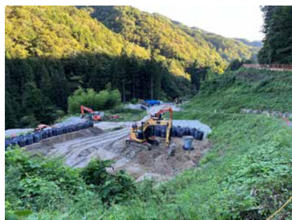
萩の平 非常口ヤード 令和5年9月5日

区間①の信号は黒川橋補修工事が完了しましたので、10月12日から区間①のみの従来のセンサー式信号システムに戻っています。