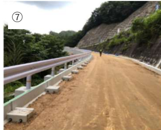
【防護柵完成】 防護柵は完成しました。