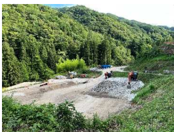
萩の平 非常口ヤード 令和5年8月7日

引き続き、萩の平ヤード進入路で土工事（切土・法面工、盛土補強土工）、区間③で水道工事を行う予定です。