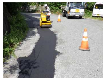
石割水道工事 舗装工 令和5年8月4日