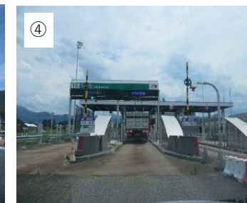
【高速道路】 中央道→東海環状道→東海北 陸道の福光ICで降ります。