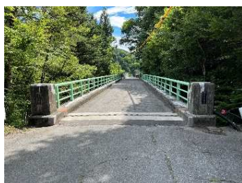
深沢橋 令和5年8月9日