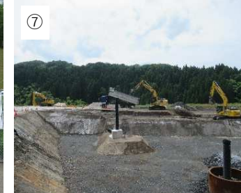
【北陸環境サービス】 荷降ろししています。 おつかれさまでした。