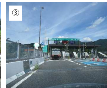
【高速道路】 飯田山本ICから中央道 に乗ります。