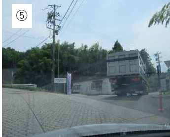
【北陸環境サービス】 北陸環境サービスに到着しました。 約300km走りました。