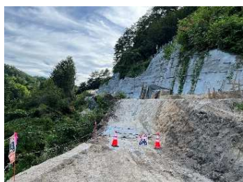
萩の平 ヤード進入路 令和5年8月7日