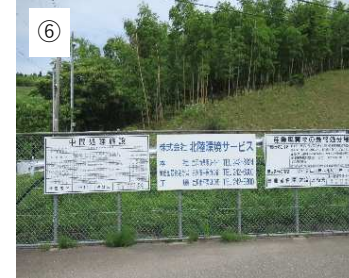
【北陸環境サービス】 最終処分場です。