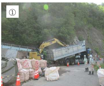
【積込】 廃棄物をバックホウで ダンプに積み込んでいます。

今回は、区間①の廃棄物のダンプを追いかけました。遠く金沢の処分場に持って行きました。