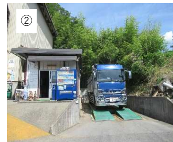
【計量】 過積載防止のため、恵那興業 の計量計で正確に計量します。