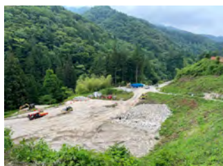
萩の平 非常口ヤード 令和5年7月5日

引き続き、萩の平ヤード進入路で土工事（切土・法面工、盛土補強土工）、区間③④で水道工事を行う予定です。