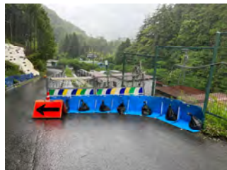
村道1-20号線 区間①下流大雨対策 令和5年7月13日