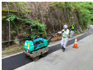
石割水道工事 舗装工 令和5年7月10日