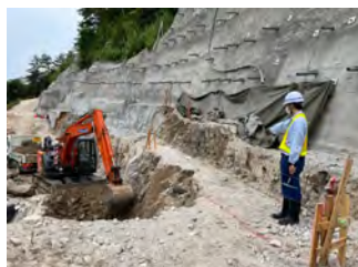
萩の平ヤード進入路 切土工 令和5年7月3日