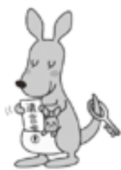
法務省 遺言書ほかんぐるー