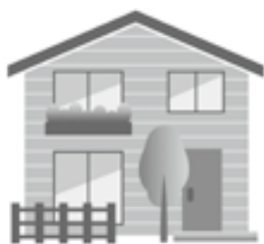
令和6年度は「評価替え」の年です