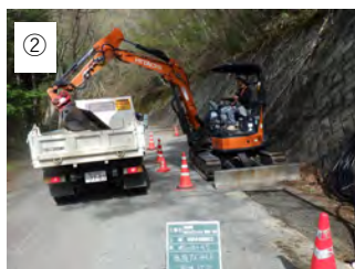
② 【舗装撤去】 切断した舗装を撤去します。