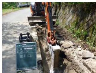
石割水道工事 ブレーカー掘削 令和5年5月22日