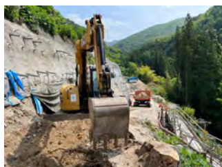
萩の平ヤード進入路 切土工 令和5年5月22日