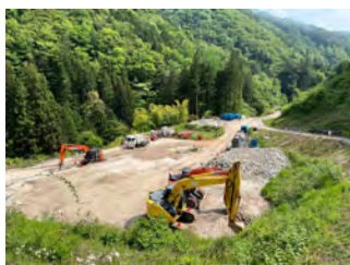
萩の平 非常口ヤード 令和5年5月22日

区間①上流部、区間②、区間⑤につきましては工程が決まりましたら別途ご案内いたします。