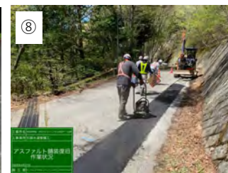
⑧ 【舗装工】 As合材で舗装します。これで完成です。