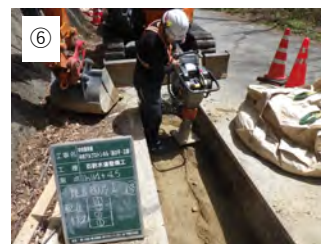
⑥ 【埋戻工】 水道管のまわりは砂で、残りは③で掘削した土で埋戻します。