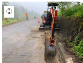
③ 【掘削工】 バックホウで掘削します。