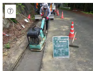
⑦ 【路盤工】 砕石路盤を敷均し転圧します。