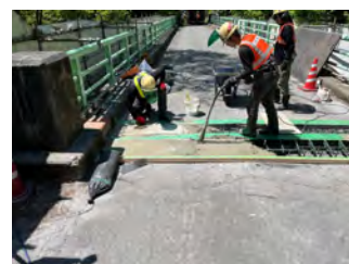
深沢橋補修工事 伸縮ジョイント工 令和5年5月11日