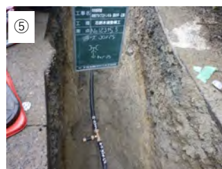
⑤ 【水道管敷設】 水道管を敷設します。