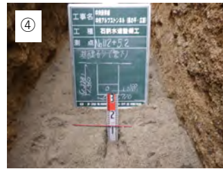
④ 【基礎砂】 基礎砂を敷均します。