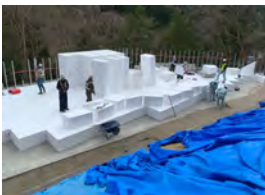
発泡スチロール据付