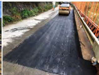
村道舗装補修状況 令和4年10月1日