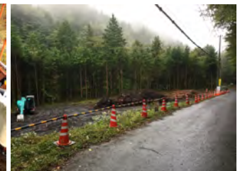
昭和橋ヤード整備状況 令和4年10月7日