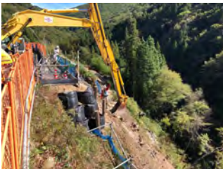
進入路切土状況 令和4年10月6日

詳細日時は、村道1-20号線と国道256号交差点付近にお知らせ看板を設置を設置しますので、ご確認ください。