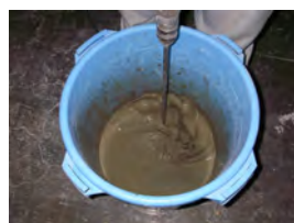
混ぜています。（試験室）