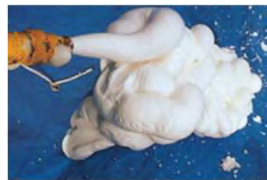
モルタルに写真の気泡を混ぜて作成します。