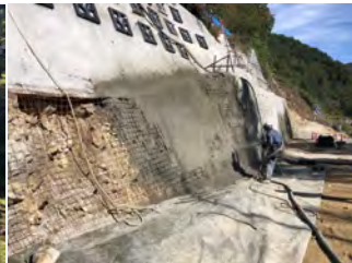
進入路法面工吹付状況 令和4年10月11日