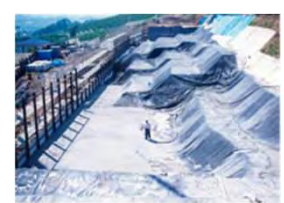
発泡モルタル打設状況