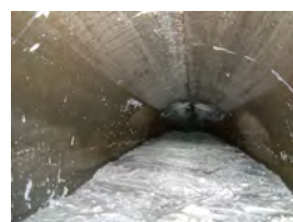
配管の充填に使用されます。