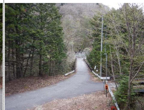
測定車から北風景