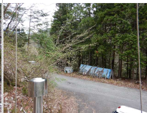
測定車から西風景