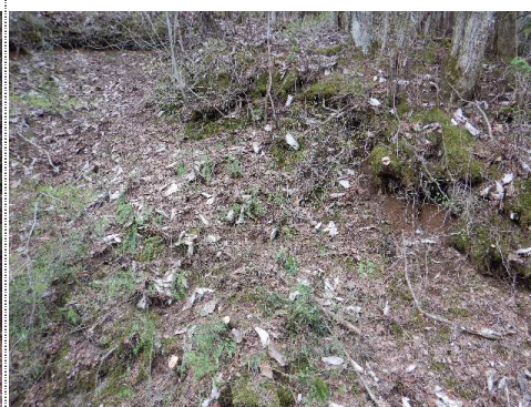
測定車から南風景