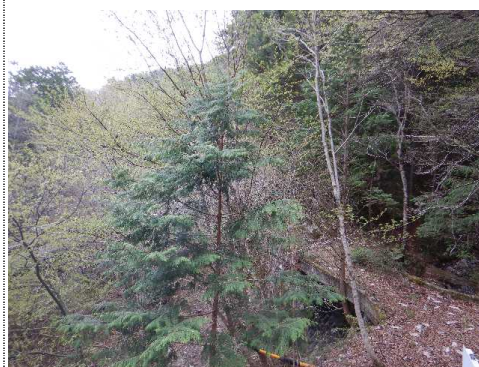
測定車から東風景