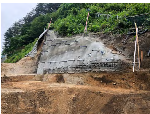
進入路(終点側) 令和4年6月14日