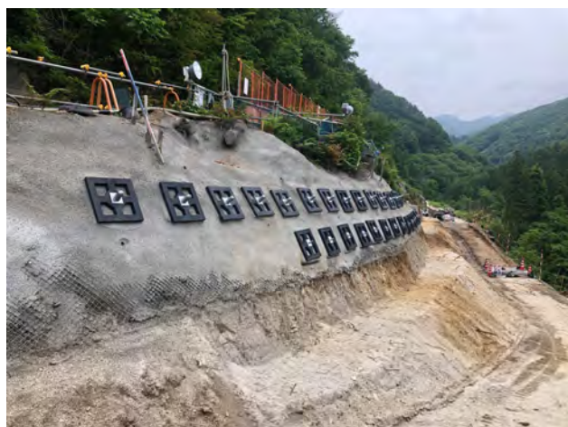
進入路(起点側) 令和4年6月14日