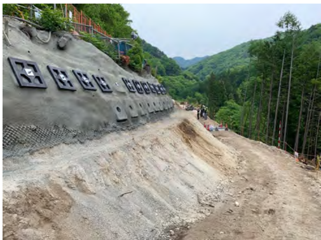
進入路(起点側) 令和4年5月24日