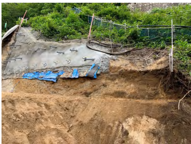
進入路(終点側) 令和4年5月30日