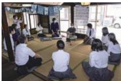
阿智高校地域政策コース 観光エリアとの連携