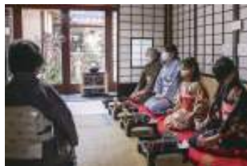
古民家で体験イベント