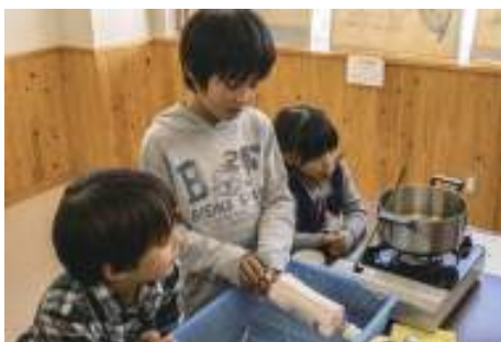
阿智祭（お蚕さまの糸とり体験）