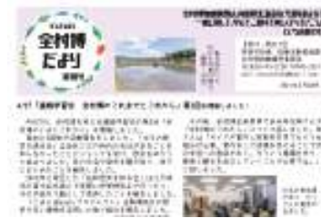
全村博だより発行 HP・SNS 運用