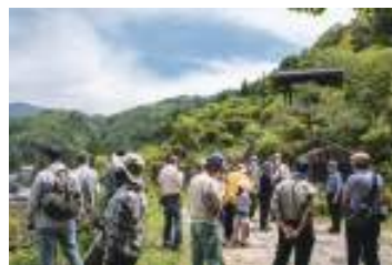
村民が地域を知る