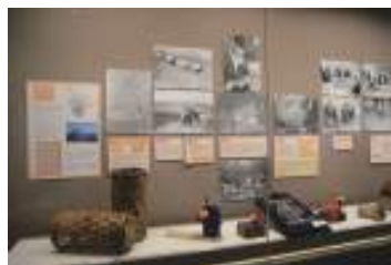
はくき木館 企画展