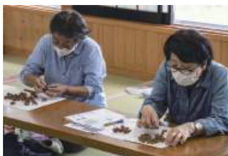
セミのぬけがら調査