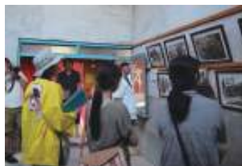
地域の魅力を伝える