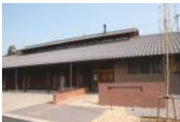
満蒙開拓平和記念館など 6館