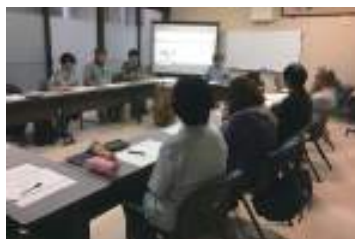
聞き書きプロジェクト