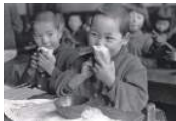
農村記録写真の村 熊谷元一写真