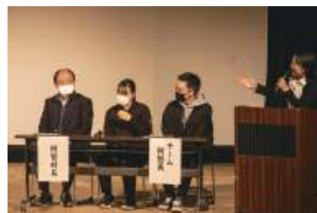
阿智祭 （舞台発表・地域資源クイズ大会）