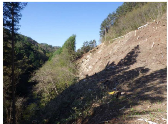
伐採（ヤード進入路）