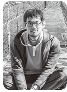
全村博物館構想担当