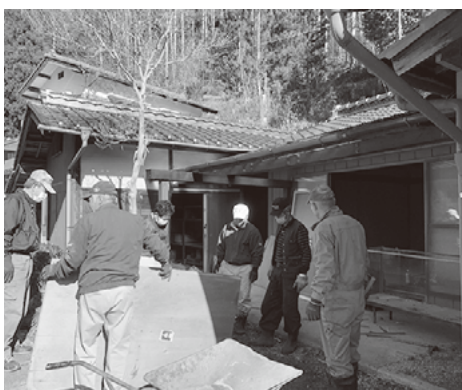
いい天気で作業も進みました