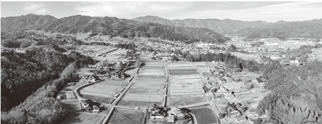
備中原からドローン撮影 (パノラマ)