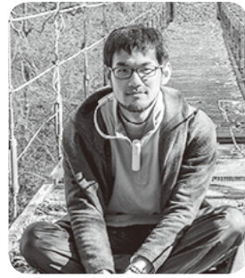
全村博物館構想担当