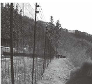
柵を見上げるサル

2年目も沢山学んで、色々なことにチャレンジしたいと思っておりますのでよろしくお願ひいたします。