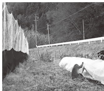
トンネルをのぞくサル