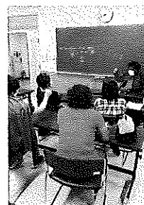
英会話教室の様子

①エンジョイ・イングリッシュ 毎週月曜日 19時30分～21時00分 阿智村中央公民館 指導者 スタースク・マーク 参加者 6名 施設閉館中は、ライン内で教室を開催