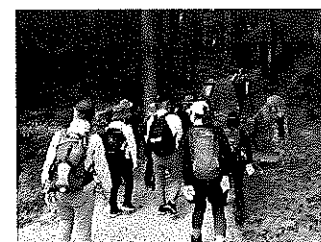
これから馬籠峠に挑む

史跡巡りや農業・観光と絡めたウォーキングイベントを開催した。大妻籠から馬籠まで、地元ガイドの説明でウォーキングを楽しんだ。