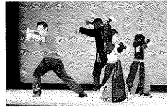
太極拳・八極拳阿智祭発表風景

11.5 (土)・11.6 (日) 中央公民館 ステージ発表 太極拳・八極拳 作品展示 生け花教室、絵画教室 飲物販売 コロナ禍中止