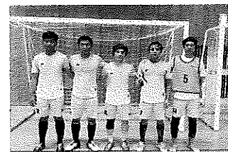
フットサル大会優勝チーム

中学生、高校生、成人2の計4チームが参加、リーグ戦を実施した。準備や審判・運営等にみんなが関わり、参加者で作り上げた大会になった。