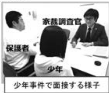
少年事件で面接する様子

○少年事件⇒少年や保護者と会ったり、家庭や学校を訪問したりして、様々な視点から情報を集め、非行の原因やどうすれば立ち直ることができるのかを考え、裁判官に報告するとともに、教育的な働き掛けを行っています。