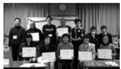
↑修了式後に講師の先生、塾生と一緒に