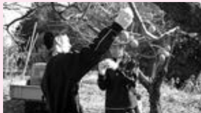
↑柿の収穫を体験しました

秋になり、大切に育ててきた大豆やそばの収穫と下伊那特産の柿の収穫体験をしました。また、農場では冬の野菜である白菜も育てました。そばは収穫後そば粉にし、ちさと東においてそば打ち体験を行わせていただきました。