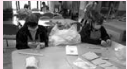
↑夢のつばさで実習しました

2年生は「夢のつばさ」、「阿智荘」、「介護ホームそら」、「伍和保育園」などの地域の施設に実習に行かせていただきました。3年生は手話や点字を学んでいます。成果発表会では手話を使ったパフォーマンスを行う予定です。