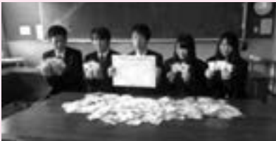
↑納品式には3年生5名が参加しました

2・3年生の所属の生徒29名が作った水引ストラップを「阿智☆昼神観光局」に納品しました。デザインは生徒自身が考え、1ヶ月ほどで378個を作成しました。水引は観光局が実施するアンケートに答えてくださった方への返礼品として利用されます。