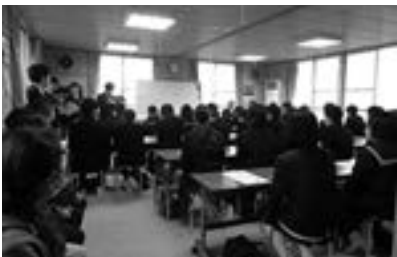
↑当日の講義室は中学生でいっぱい

昨年の11月18日に『神坂学習塾 体験・体感授業』を行いました。参加した中学生は国語、数学、英語の各授業を受け、神坂学習塾を体験しました。近隣の中学生29名が参加し大いに盛り上がりました。