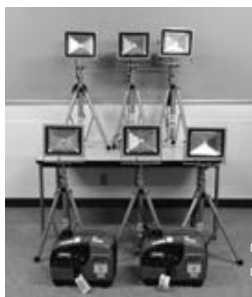
●発電機 2台 ●投光機 6台