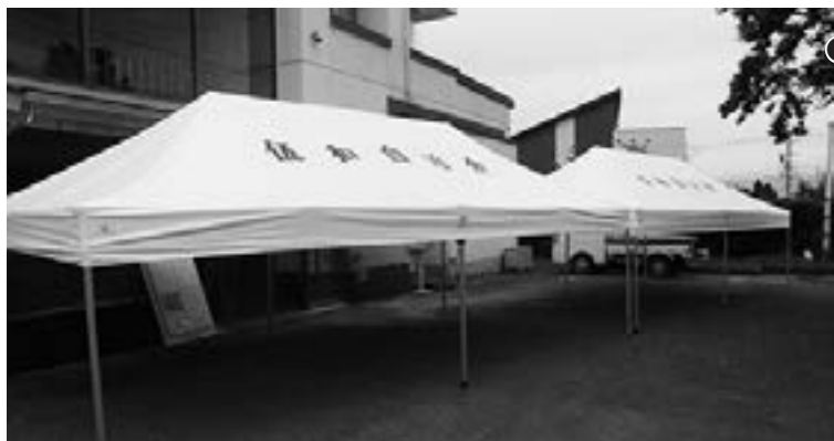
●ワンタッチテント 2張

宝くじの社会貢献事業である「コミュニティ助成事業」を活用し、伍和自治会ではイベント用品を整備しました。