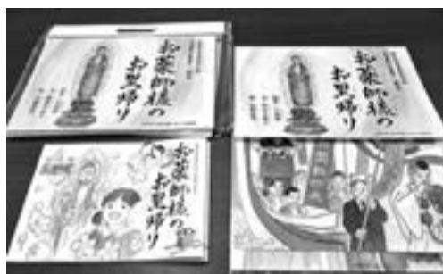
寄贈いただいた紙芝居と冊子