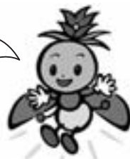
長野県選挙啓発 マスコットキャラクター 「ほたりちゃん」

国民審査の期日前投票の開始日について、現行は選挙期日前七日となっているものを、衆議院総選挙と同様に、総選挙の公示日の翌日（通常、期日前十一日）とするものです。