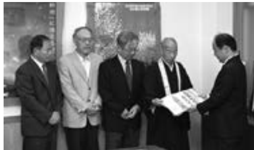
役場を訪れた入亮純長岳寺住職と中関、上中関、駒場区の自治会長のみなさん