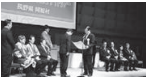
3月3日に東京国際フォーラムで行われた授賞式

全国各地で数多く開催されている地域の活力を生み出すイベントを表彰し、全国に向けて紹介することによって、ふるさととの更なる発展を応援する「第21回ふるさとイベント大賞」(主催：一般社団法人地域活性化センター)で、阿智村の「天空の楽園 日本一の星空ナイトツアー」が優秀賞(地域活性化センター会長賞)を受賞しました。(全国で8団体が受賞、県内では1団体のみ)