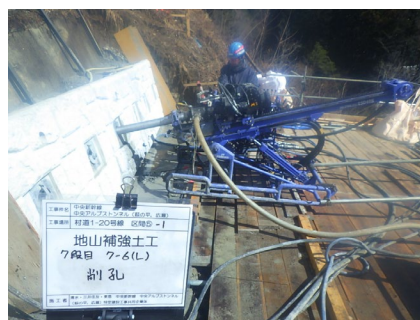
村道区間⑤ パンウォール工_アンカー さっこう