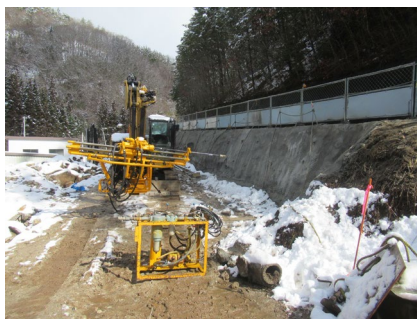
村道区間①下流 のりめんこう 法面工