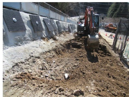
村道区間①下流 土工事