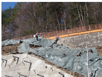
ヤード進入路 のりめんこう 法面工

現在、萩の平非常口ヤード進入路で土工事および法面工 のりめんこう を、村道区間①で土工事、法面工 のりめんこう 、村道区間④⑤でパンウォール工を行っています。