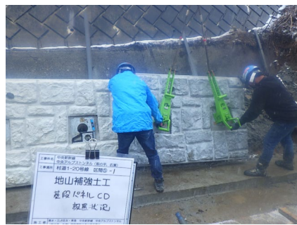
村道区間⑤ パンウォール工_パネル設置