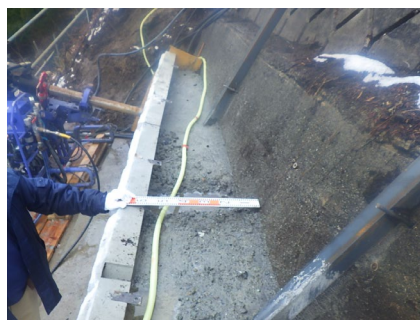
村道区間⑤ パンウォール工_裏込め ウツゴメ