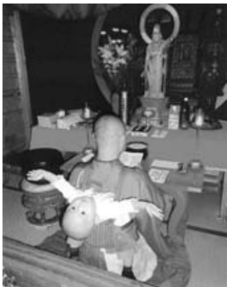
阿智村賞 『空は広いなア』 鋤柄郁夫（撮影地：長野県高森町）