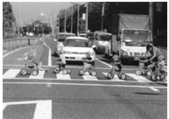
優良賞 『三輪車が行く』 古谷 保 (撮影地：大阪府堺市)