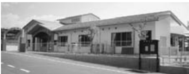
あふち保育園の外観