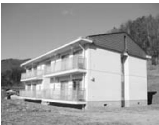
屋神温泉従業員住宅