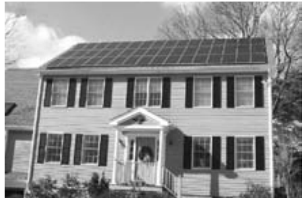
太陽光発電システム

設置するシステムの発電量 1 kwあたり5万円を補助します。ただし、限度額は20万円です