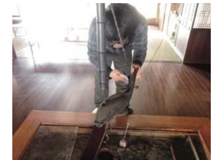
トンキラ農園掃除