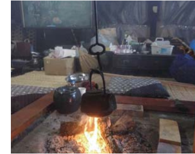
囲炉裏の火起こし