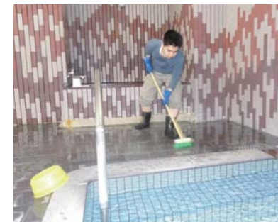
風呂掃除・館内清掃