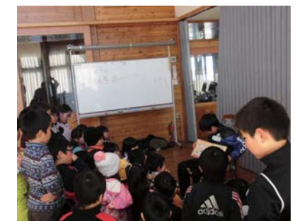
なみあい育遊会訪問