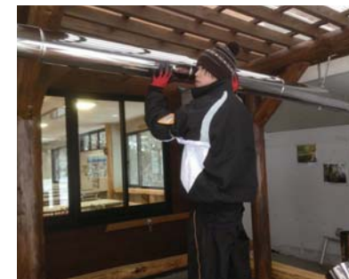
まきストーブの設置